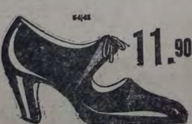
Cabritilla Mayer Gdo. 7.

Hoy "EL LIMITE", Bm. Mitre 1129, inicia la entrega de cada par de calzado en un ESTUCHE-VALIJA-COSTURERO, que sólo por ser obra de "EL LIMITE" puede ser realizada sin aumentar el precio del calzado y sin desmejorar la calidad.