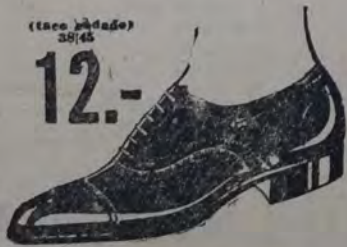
Oscaria negra y color.

Aunque no necesite calzado, visitenos y conozca nuestro OBSEQUIO