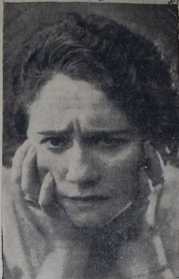
LA PRESTIGIOSA ACTRIZ QUE DIRIGE EL CONJUNTO INFANTIL que prestará su desinteresado concurso al festival organizado para el 31 del corriente en la Casa del Pueblo, poniendo en escena el cuadro de costumbres nacionales "Patio criollo".